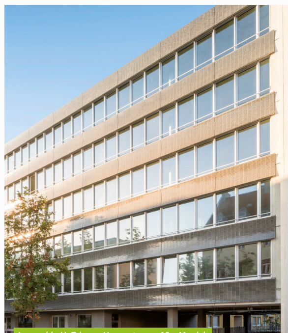
Immeuble H. Trium - Hansastrasse 10 - Munich