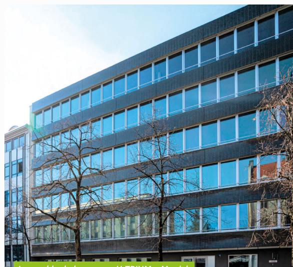
Immeuble de bureaux - H TRIUM - Munich

* Rappel : au 1 er semestre 2021 (6 mois), le TOF « ASPIM » était de 98,3 % et le TOF « BRUT » de 1,7 %.