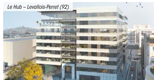
Le Hub - Levallois-Perret (92)