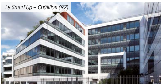
Le Smart'Up - Châtillon (92)

La mesure de cette performance, nette de tous frais, confirme la nature immobilière de cet investissement dont les résultats s'apprécient sur le long terme. Les performances passées ne sont pas un indicateur fiable des performances futures.