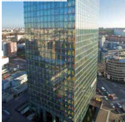
Cityscope – Montreuil (93)

*** Pour les non résidents seuls les immeubles détenus en France sont pris en compte.