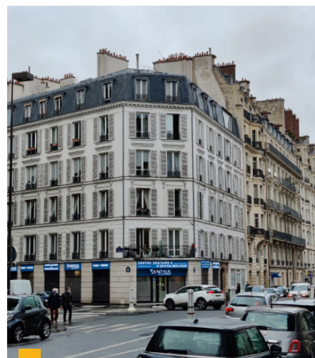
91, rue de Prony à Paris (17 ème )