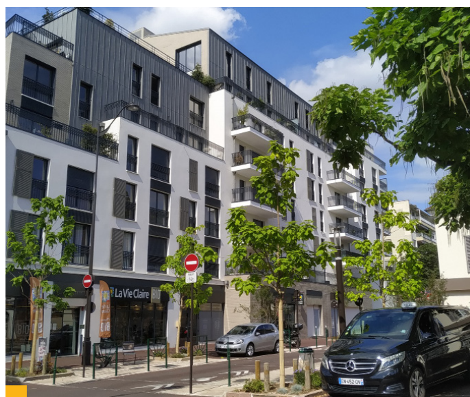
1, rue Pierre Brossollette à Rueil-Malmaison (92)

Aucun nouvel arbitrage n'a été réalisé au cours du semestre.