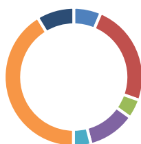
Répartition du patrimoine par ville (m 2 )