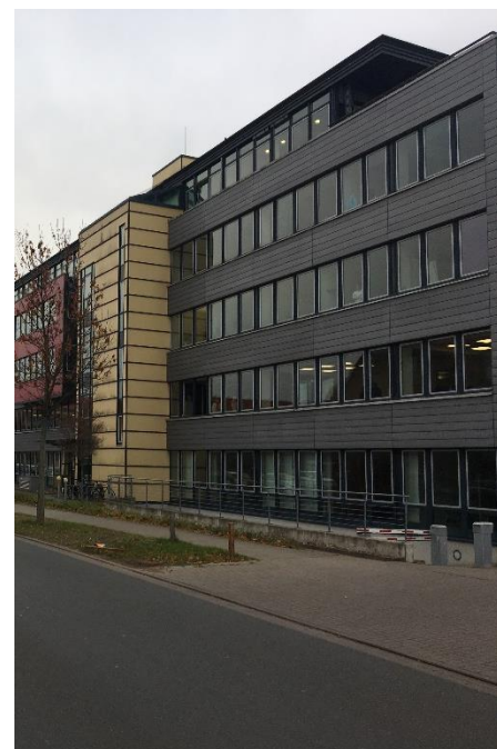
10 ème acquisition - Hanovre

Le premier acompte sur dividende a été distribué fin avril 2019 au titre des bénéfices réalisés au premier trimestre 2019. L'acompte trimestriel s'élève à 10 € pour une part en pleine jouissance sur le trimestre.