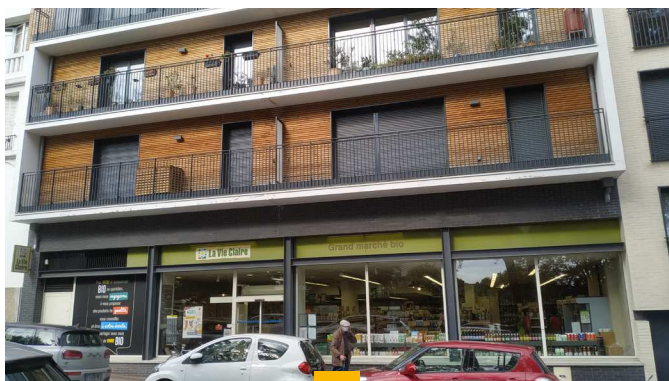
PIERRE EXPANSION SANTÉ Fontenay-aux-Roses (92) Locaux de 282 m 2 en copropriété Loué en 6 ans fermes à La Vie Claire Rendement : 5,19% AEM Acquisition signée