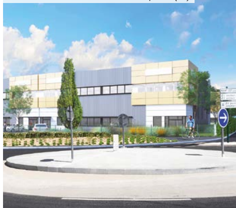
Parc du Terre – Bât. B Tranche 2 – Carquefou (44)

*** Pour les non résidents seuls les immeubles détenus en France sont pris en compte.