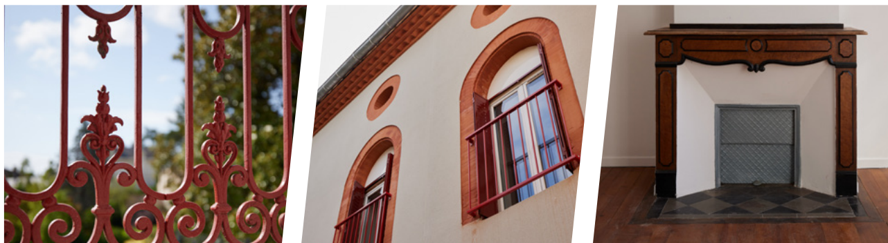
^ #3 - 3 rue du Rempart Touronc. Pamiers