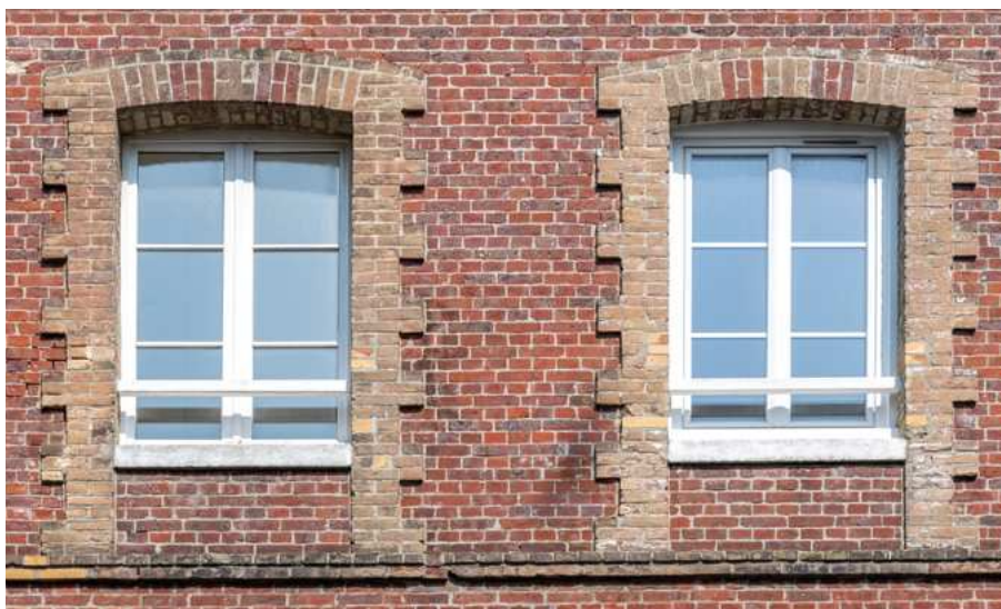
Acquisition #6 - 44, rue Guerrier 76200 Dieppe