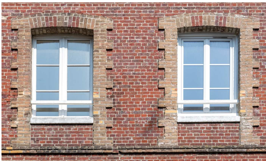
Acquisition #6 - 44, rue Guerrier 76200 Dieppe