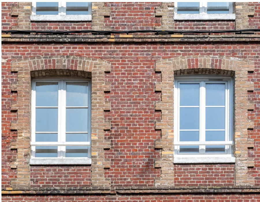
Acquisition #6 - 44, rue Guerrier 76200 Dieppe