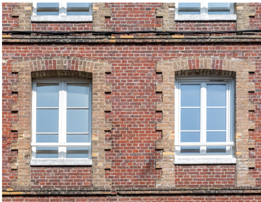
Acquisition #6 - 44, rue Guerrier 76200 Dieppe