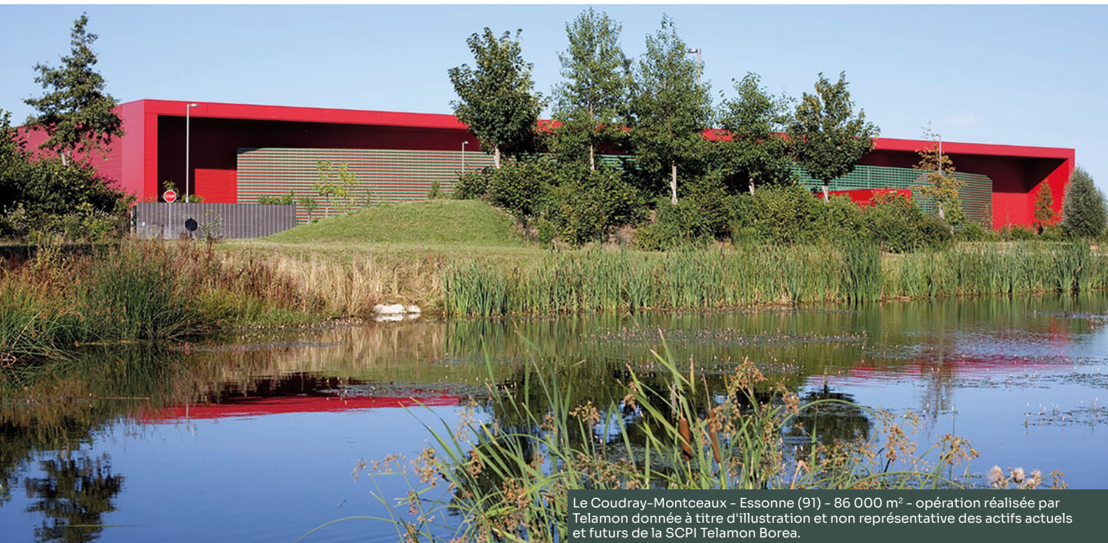
Le Coudray-Montceaux - Essonne (91) - 86 000 m 2 - opération réalisée par Telamon donnée à titre d'illustration et non représentative des actifs actuels et futurs de la SCPI Telamon Borea.