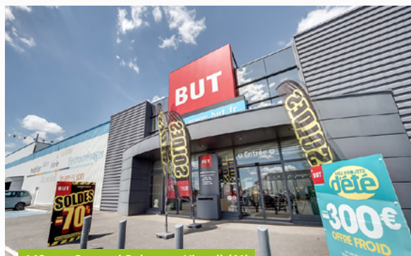
148, rue Bernard Palassy - Vineuil (41)

Au cours du 1 er semestre 2022, les 2 distributions trimestrielles réalisées sont d'un montant identique de 3,60 €/part chacune. Afin d'optimiser la distribution et préserver le niveau confortable de report à nouveau, la distribution du 2 ème trimestre comporte en partie (à hauteur de 2,50 €/part) de la plus-value réalisée au cours des arbitrages passés.