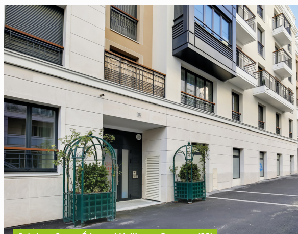
Crèche - 3, rue Édouard Vaillant - Puteaux (92)

Afin de préserver le bon niveau de report à nouveau tout en optimisant la distribution, l'acompte du 3 ème trimestre 2021 est identique à celui du trimestre précédent et s'établit à 3,60 € par part, dont 2,50 € par part provenant du stock de plus-values réalisées au fur et à mesure des arbitrages passés.