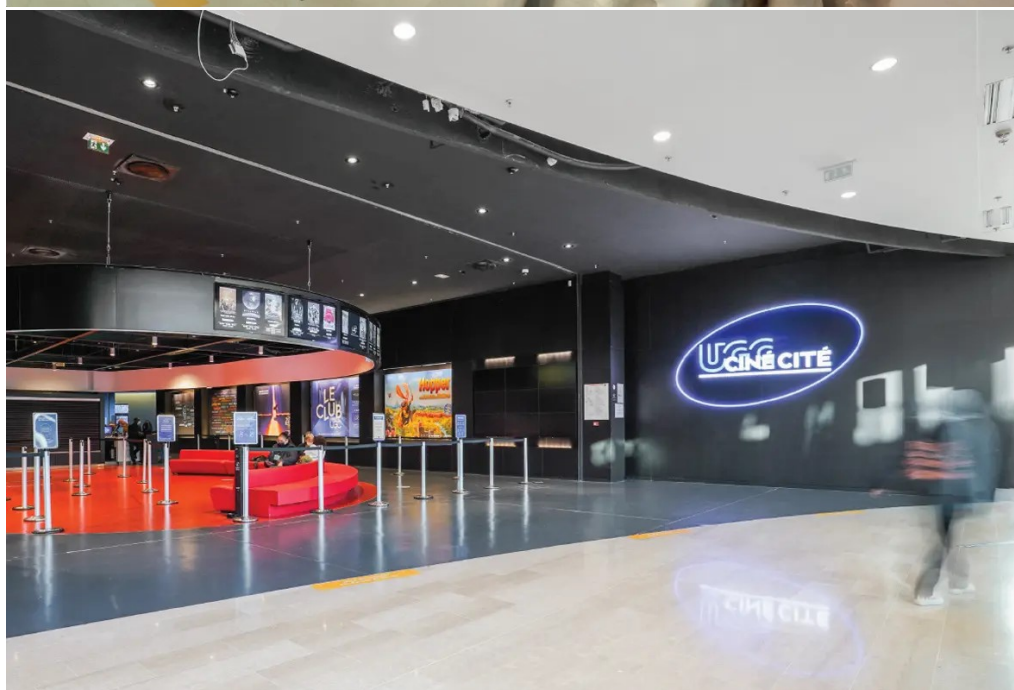
Centre commercial O'Parinor - Aulnay-Sous-Bois (93)