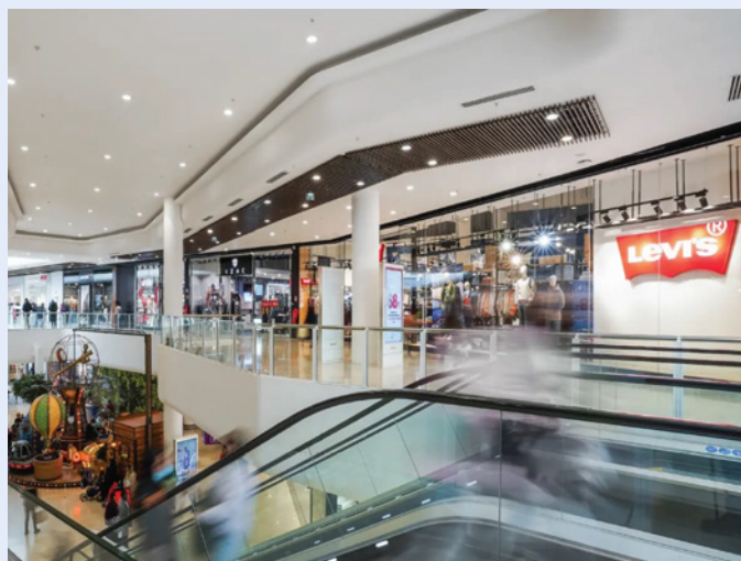
Centre commercial O'Parinor - Aulnay-Sous-Bois