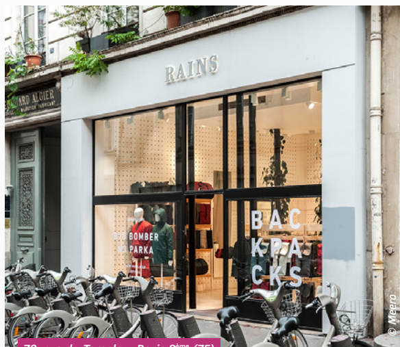
78, rue du Temple – Paris 3 ème (75)

Aucune acquisition ni cession n'a eu lieu au cours du trimestre.