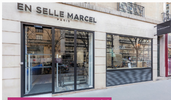
65-71, avenue de Suffren – Paris 7 ème (75)

Un actif de pied d'immeuble situé au 98, rue de Clignancourt à Paris 18 ème a été cédé le 24 janvier pour environ 0,3 M€ (prix net vendeur). Par ailleurs, l'actif situé avenue de la Libération à Orléans (45) était sous promesse de vente au 31 mars 2023. Il a été définitivement vendu le 14 avril pour 2,4 M€ (prix net vendeur).