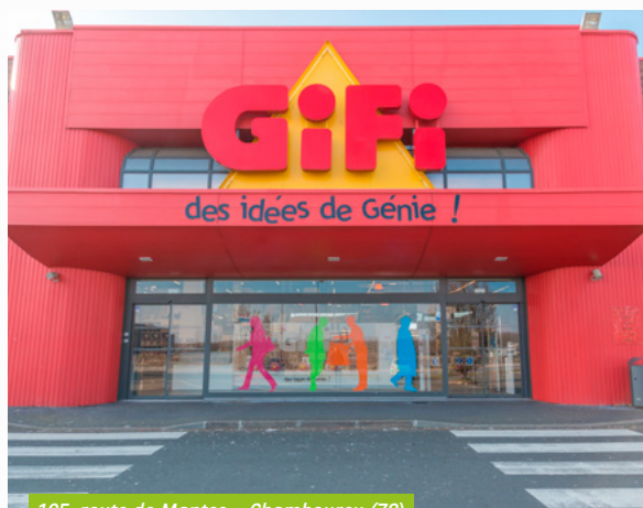
105, route de Mantes - Chambourcy (78)

Le 1 er octobre 2022, BNP Paribas Securities Services (BP2S), banque dépositaire de votre SCPI Pierre Sélection, a fusionné avec sa société mère BNP Paribas. BNP Paribas devient donc la banque dépositaire de votre SCPI, sans incidence sur les fonctions et opérations mises en place par la société de gestion, BNP Paribas Real Estate Investment Management France.