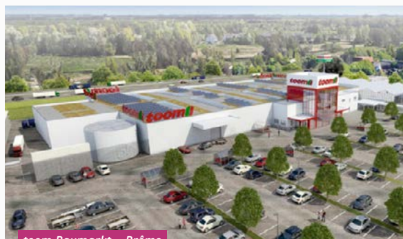
toom Baumarkt - Brême