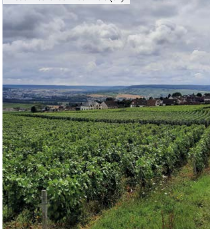
Lieudit Les Tahus - Hautvillers (51)

(3) Disponibles dans le prochain bulletin trimestriel suite à l'arrêté comptable du 31/12.