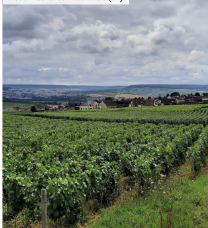
Lieudit Les Tahus - Hautvillers (51)

(3) Pour les non résidents, seuls les immeubles détenus en France sont pris en compte.