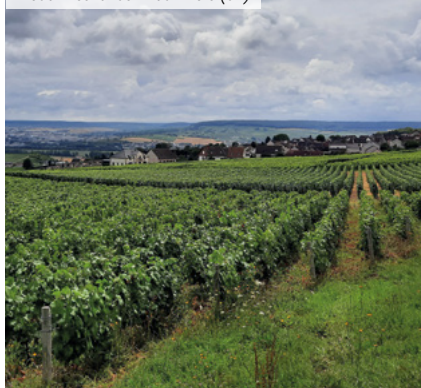
Lieudit Les Tahus - Hautvillers (51)

(2) Disponibles dans le prochain bulletin trimestriel suite à l'arrêté comptable du 31/12.