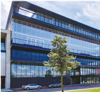
Suites Cloud 9, Am Paßmoorweg 6 – Hambourg – Allemagne

*** Pour les non résidents seuls les immeubles détenus sont pris en compte.