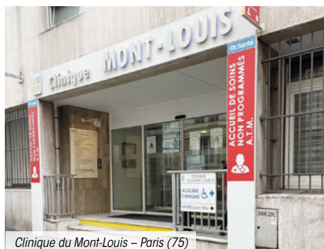
Clinique du Mont-Louis – Paris (75)