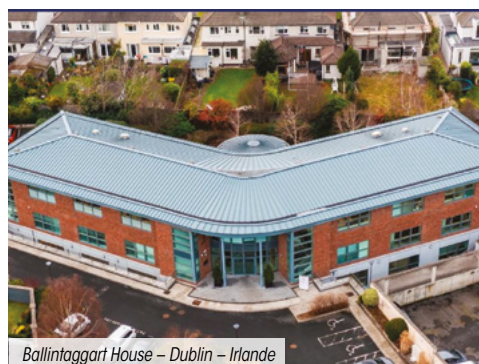
Ballintaggart House – Dublin – Irlande

La SCPI n'a enregistré aucun arbitrage ce trimestre.