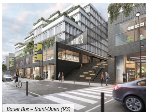
Bauer Box – Saint-Ouen (93)