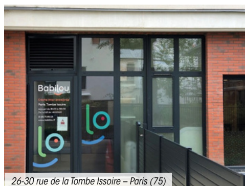
26-30 rue de la Tombe Issoire – Paris (75)