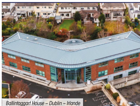
Ballinagart House – Dublin – Irlande

La SCPI n'a enregistré aucun arbitrage ce trimestre.