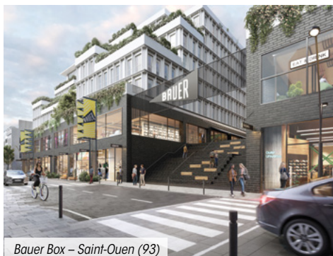
Bauer Box – Saint-Ouen (93)