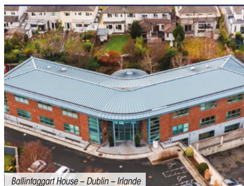
Ballintaggart House – Dublin – Irlande

La SCPI n'a enregistré aucun arbitrage ce trimestre.