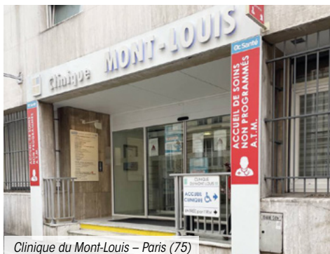
Clinique du Mont-Louis – Paris (75)