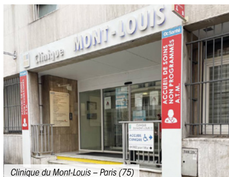
Clinique du Mont-Louis – Paris (75)