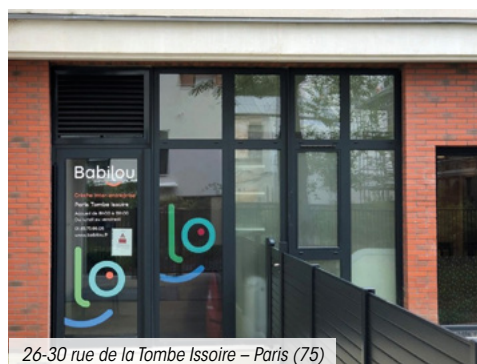
26-30 rue de la Tombe Issoire – Paris (75)