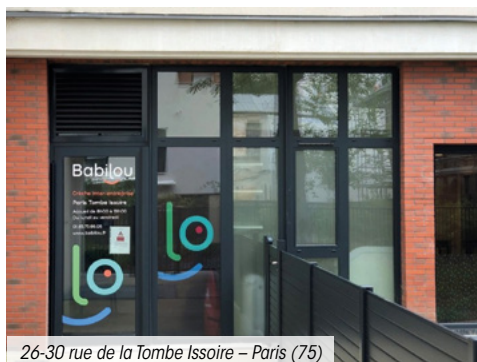
26-30 rue de la Tombe Issoire – Paris (75)