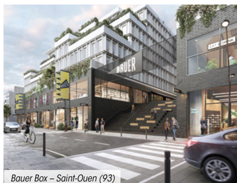
Bauer Box – Saint-Ouen (93)