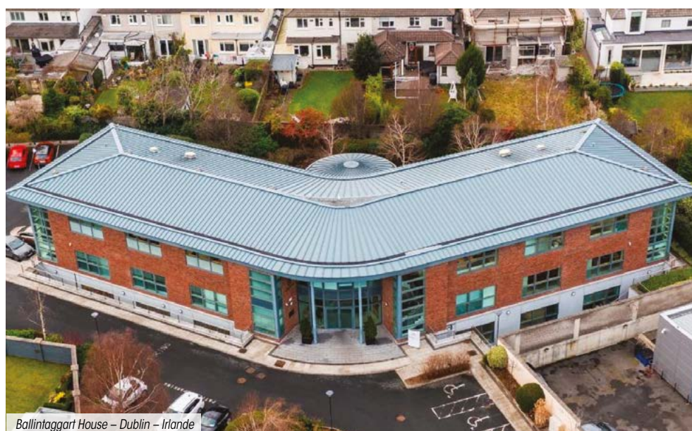
Ballinattagart House – Dublin – Irlande