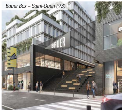
Bauer Box – Saint-Ouen (93)