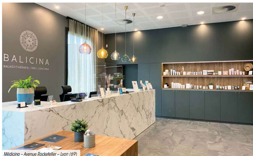
Médecina – Avenue Rockefeller – Lyon (69)

La SCPI n'a enregistré aucun arbitrage ce trimestre.