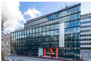
CLICHY (92) – 30/32 rue Henri Barbusse

Le 2 février 2022, LAFFITTE PIERRE a étoffé sa diversification patrimoniale en investissant dans un campus loué intégralement à l'EM-Normandie, qui accueillera à terme 3 000 étudiants sur le site.