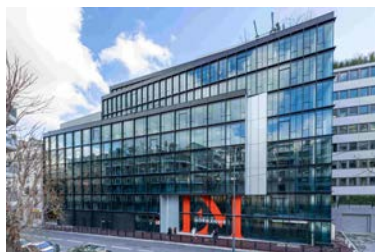
CLICHY (92) – 30/32 rue Henri Barbusse

Le 2 février 2022, LAFFITTE PIERRE a étoffé sa diversification patrimoniale en investissant dans un campus loué intégralement à l'EM-Normandie, qui accueillera à terme 3 000 étudiants sur le site.