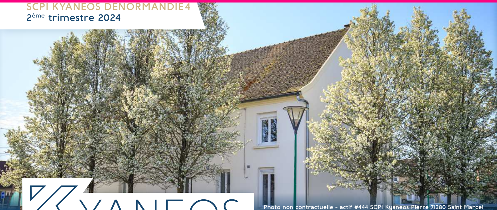
Photo non contractuelle - actif #444 SCPI Kyaneos Pierre 71380 Saint Marcel