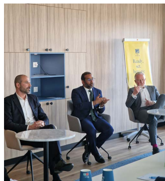
Partenariat et Road Show avec la Compagnie des CGP