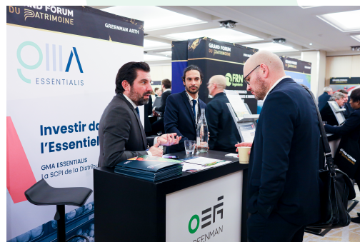
Le Grand Forum du Patrimoine 2023