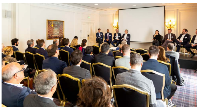
Intervention GRI France 2023