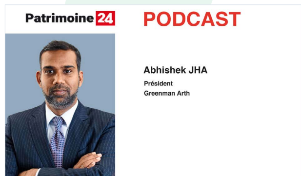
Podcast en partenariat avec Patrimoine 24