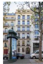
Paris 8 ème – 9, avenue de Friedland

La performance Globale Annuelle est un nouvel indicateur de performance destiné à améliorer la comparabilité des SCPI. Cet indicateur, qui, dans le cas de FRUCTIPIERRE, additionne sur l'année le taux de distribution et la variation du prix acquéreur moyen, s'établit à 3,22% pour l'année 2025. Elle est nettement supérieure aux taux nationaux calculés pour l'ensemble des SCPI à prépondérance bureaux (-0,3%) et pour l'ensemble des SCPI d'entreprise (1,5%).