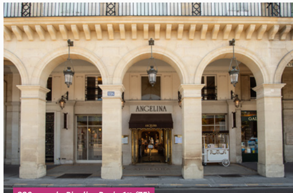
226, rue de Rivoli – Paris 1 er (75)

DOCUMENT D'INFORMATION DU 3 ÈME TRIMESTRE 2023