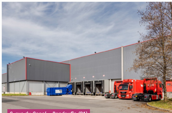
6, rue du Canal – Bondoufle (91)

Au cours du 1 er trimestre de l'année 2023, une signature d'une promesse de vente sur l'immeuble vacant situé au 28, rue d'Arcueil à Gentilly (94) a eu lieu pour un montant de 25 M€ hors droits. La réitération est prévue au plus tard le 2 août 2024.