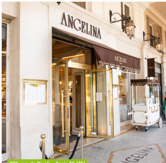
226, rue de Rivoli - Paris 1 er (75)

Le 1 er octobre 2022, BNP Paribas Securities Services (BP2S), banque dépositaire de votre SCPI France Investipierre, a fusionné avec sa société mère BNP Paribas. BNP Paribas devient donc la banque dépositaire de votre SCPI, sans incidence sur les fonctions et opérations mises en place par la société de gestion BNP Paribas Real Estate Investment Management France.