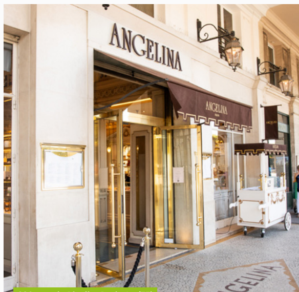
226, rue de Rivoli - Paris 1 er (75)

Le 1 er octobre 2022, BNP Paribas Securities Services (BP2S), banque dépositaire de votre SCPI France Investipierre, a fusionné avec sa société mère BNP Paribas. BNP Paribas devient donc la banque dépositaire de votre SCPI, sans incidence sur les fonctions et opérations mises en place par la société de gestion BNP Paribas Real Estate Investment Management France.