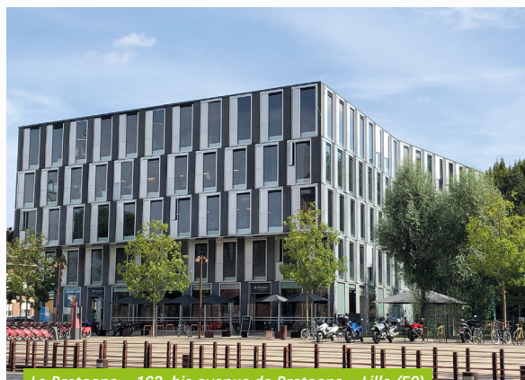
Le Bretagne – 163, bis avenue de Bretagne – Lille (59)

Au niveau locatif, le taux d'occupation brut de votre SCPI a légèrement progressé pour atteindre 90,8 % au 3 ème trimestre (contre 90,4 % au 1 er semestre 2021). Ce taux conforte une fois de plus l'attractivité du patrimoine de votre SCPI et son adéquation avec la demande du marché. L'activité locative aura été particulièrement intense ce trimestre pour l'actif Le Bretagne à Lille (59). La velléité de départ d'un des locataires s'est présentée comme une opportunité pour la SCPI : le principal locataire a en effet étendu ses surfaces prises à bail, tout en permettant la sécurisation de son flux locatif pour une période ferme de 6 ans.