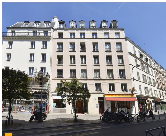
2 rue de Beccaria à Paris (75012)