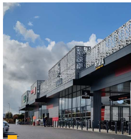
Retail Park à Tours (37)

**** Jusqu'à 2020 : TDVM. À partir de 2021 : Taux de distribution.