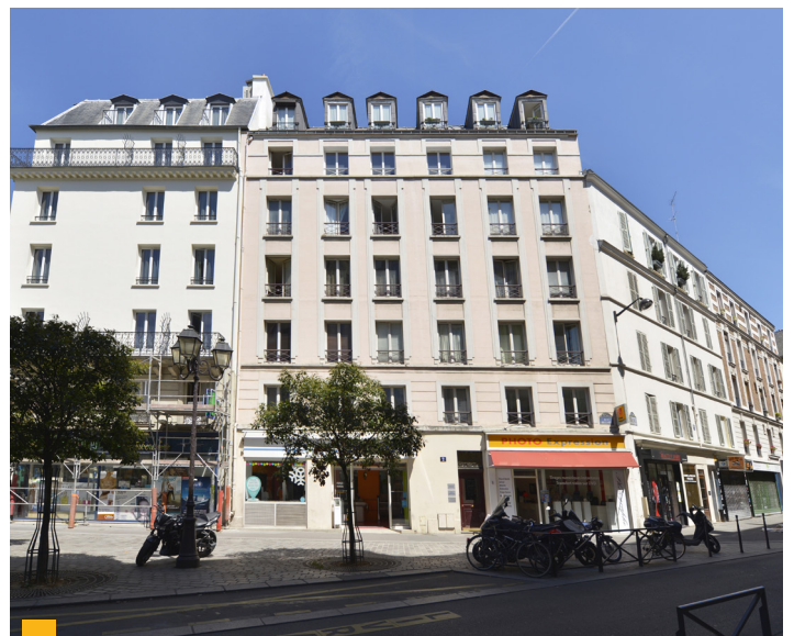
2 rue de Beccaria à Paris (75012)

Deux actifs situés à Nogent-le-Rotrou (28) et à Gruissan (11) ont été cédés en ce début de semestre pour un prix global de 4,65 M€. Votre SCPI a également vendu sa quote-part de 65% dans le centre commercial des Hauts de Clamart (92) au prix de 10,66 M€. Elle a aussi signé des promesses de vente pour 4 actifs situés à Masny-Ecaillon (59), Charenton-le-Pont (94), Fumel (47) et Bressuire (79). Ces arbitrages pourront offrir la possibilité de réinvestir dans des immeubles plus récents et plus performants.