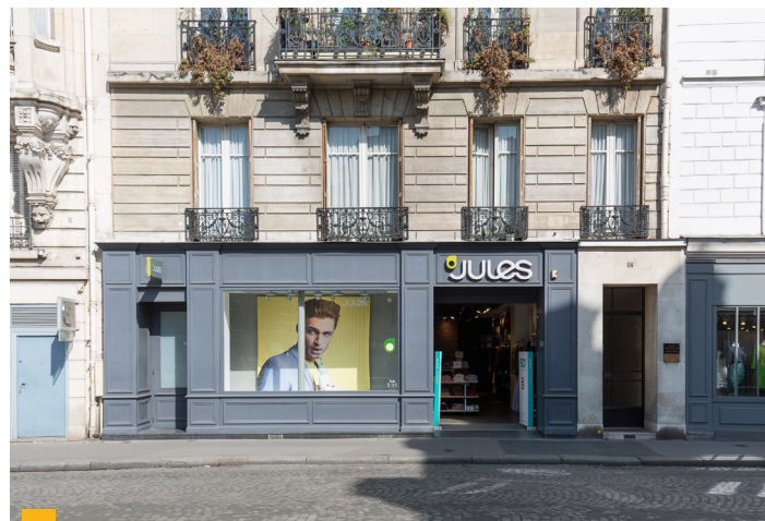
64, rue de Passy (16 ème )

Ces arbitrages étaient nécessaires pour résorber la vacance et éviter des travaux lourds, afin de pouvoir réinvestir dans de nouveaux immeubles plus récents et plus performants