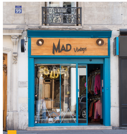
99 rue de Rennes à Paris (6 ème )

**** Jusqu'à 2020 : TDVM. À partir de 2021 : Taux de distribution.