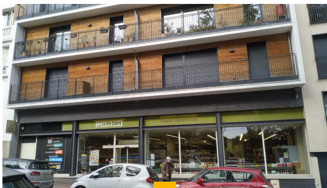
PIERRE EXPANSION SANTÉ Fontenay-aux-Roses (92) Locaux de 282 m 2 en copropriété Loué en 6 ans fermes à La Vie Claire Rendement : 5,19% AEM Acquisition signée