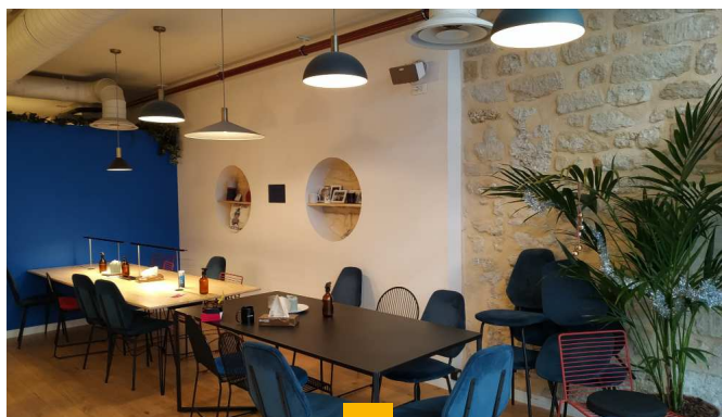
SELECTIPIERRE 2 - PARIS Bastille - Paris (11ème) Immeuble de 418 m 2 en pleine propriété Loué en 6 ans fermes Rendement : 4,01% AEM Sous promesse