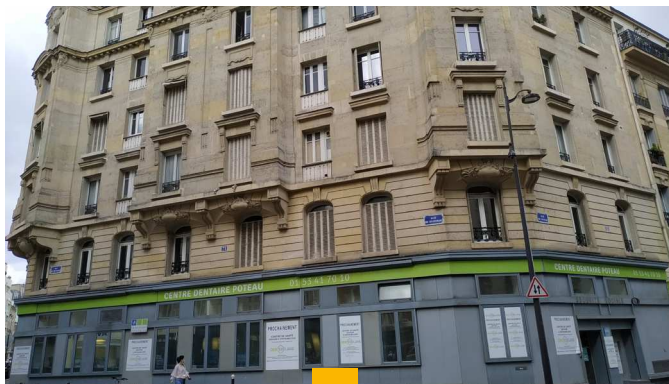
PIERRE EXPANSION SANTÉ 51 rue du Poteau - Paris (18ème) Locaux de 369 m 2 en copropriété Loué en 6 ans fermes à Dentexelans Rendement : 4,61% AEM Acquisition signée