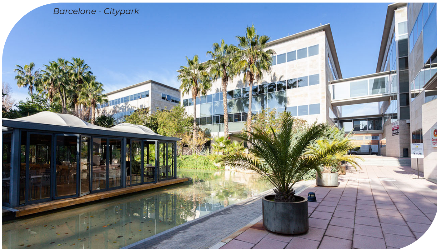
Barcelone - Citypark