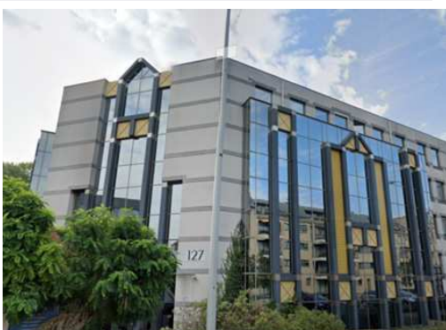
Evere - Belgique