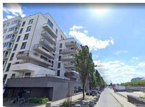
Bruxelles - Belgique