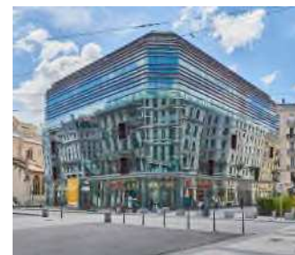
Lyon - Local commercial Place des cordeliers

Lors de l'Assemblée Générale Extraordinaire de juin 2024, vous avez voté en faveur d'une stratégie d'investissement diversifiée et non plus majoritairement dans des bureaux. À terme, cela pourrait permettre à votre SCPI de saisir davantage d'opportunités d'investissements et d'améliorer la diversification des risques patrimoniaux et locatifs.