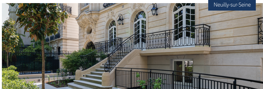
Le Mermoz Neuilly-sur-Seine

Bulletin trimestriel des SCPI édité par Allianz Immovalor, société de gestion de portefeuille, membre d'Allianz. Document non contractuel. Directeur de la publication : Christian Cutaya Coordination et réalisation : Azur Partner Communication © Allianz Immovalor. Tous droits réservés