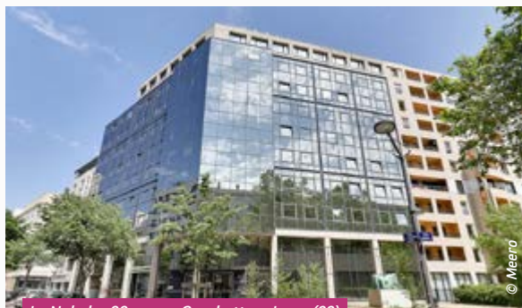
Le Nobel – 99, cours Gambetta – Lyon (69)