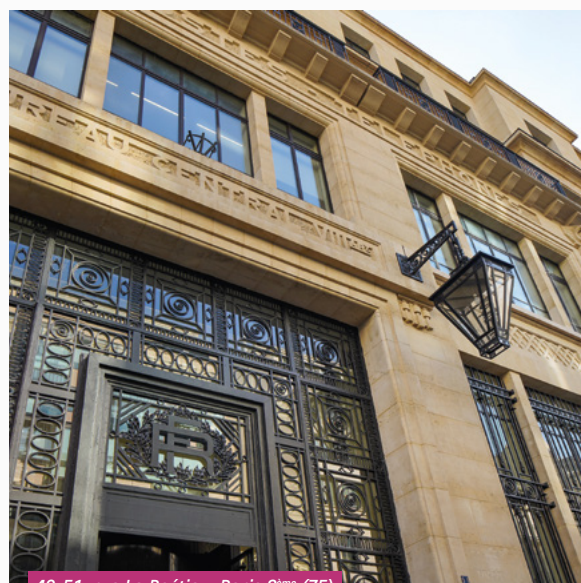
49-51, rue La Boétie - Paris 8 ème (75)