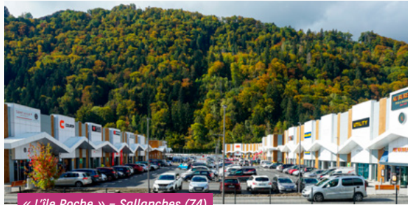
« L'île Roche » - Sallanches (74)