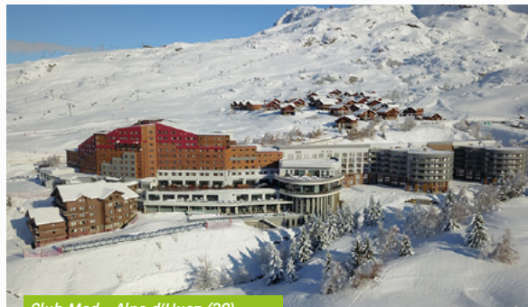
Club Med - Alpe d'Huez (38)

En ce qui concerne la collecte, environ 120 M€ ont été levés par votre SCPI, ce qui représente une hausse très significative par rapport à 2021, et un retour vers les niveaux usuels. C'est un signe de la confiance renouvelée des investisseurs dans les fondamentaux solides du véhicule.