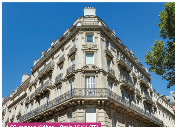
66, avenue Kléber – Paris 16 ème (75)

Par exemple, pour une souscription dont les fonds sont encaissés en novembre 2023, la jouissance des parts est ramenée au 1 er janvier 2024.