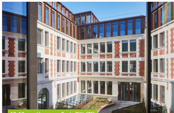
16-18, rue Vaneau - Paris 7 ème (75)

Le premier trimestre 2022 a été marqué par la signature d'une promesse d'acquisition d'un immeuble à restructurer situé rue des Colonnes du Trône à Paris 12 ème (75). Par ailleurs, la vente de l'immeuble Maille Nord III à Noisy-le-Grand (93) a été réalisée pour un prix net vendeur de 5,24 M€. Du côté de l'activité locative, pas moins de huit baux ont été signés pour un loyer total de 1,1 M€.